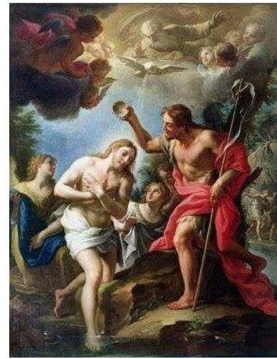
(S.S. Juan Pablo II)

Glory to you, O Father, God of Abraham, Isaac, and Jacob! You have sent your servants, the prophets, to proclaim your word of faithful love and to call your people to repentance. On the banks of the Jordan River, You raised up John the Baptist, a voice crying out in the wilderness, sent to all the region of the Jordan, to prepare the way of the Lord, to announce the coming of Christ. Glory to you, O Christ, Son of God! You came to the waters of the Jordan to be baptized by the hands of John. Upon you the Spirit descended like a dove. Upon you the heavens were opened, and the voice of the Father was heard: "This is my Son, the Beloved!" From the river blessed by your presence, You departed to baptize not only with water but with fire and the Holy Spirit. Glory to you, O Holy Spirit, Lord! By your power the Church is baptized, descending with Christ into death and rising with him to new life. By your power, we are freed from sin to become children of God, the glorious body of Christ. By your power, all fear is overcome, and the Gospel of love is preached in every corner of the earth, for the glory of God, the Father, the Son, and the Holy Spirit, to him be all honor in this Jubilee Year and in all ages to come. Amen.